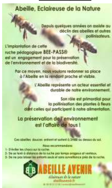
Un panneau d'information